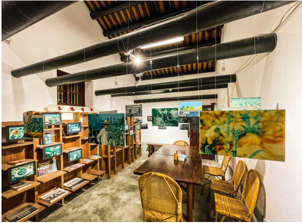
圖 7 2022 年 3-4 月的「尾擺」美濃菸業展覽