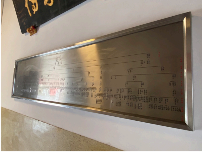
圖 5 祖堂內的鐵板