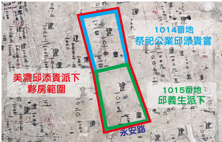
圖 6 邱添貴派下夥房地籍所有權示意圖